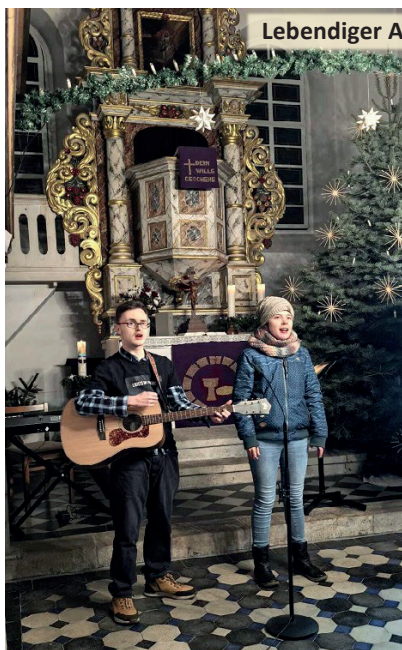
Lebendiger Adventskalender mit den „Kraftgebern“