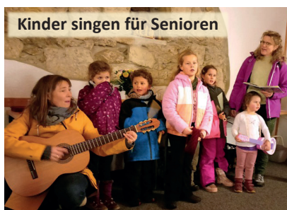
Kinder singen für Senioren

In der bis auf den letzten Platz besetzten Kirche in Großnaundorf begeisterte die musikalische Familie Hempel am 13. Dezember ihre Zuhörer mit einem adventlichen Konzert.