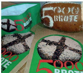
Aktion 5000 Brote - Konfis backen Brot für die Welt

Am Samstag vor dem ersten Advent durften wir wieder in der Bäckerei Kunath in Leppersdorf Brot backen - für den guten Zweck und Projekte, die Menschen in ihren Lebenswelten stützen und stärken.